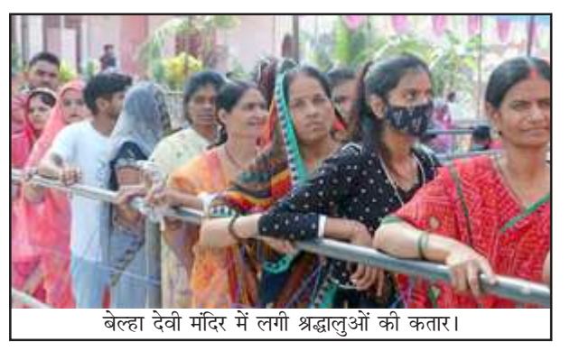
बेल्हा देवी मंदिर में लगी श्रद्धालुओं की कतार।

प्रतापगढ़। चैत्र नवरात्र के पहले दिन देवी मंदिरों में श्रद्धालुओं का उल्लासमय समागम दिखा। वहीं दिन भर घरों में कलश स्थापना में भी देवी मंत्र गुंजायमान देखा गया। नगर के बेल्हा देवी मंदिर में सुबह से ही श्रद्धालुओं की भारी भीड़ उमड़ो रही। श्रद्धालुओं ने बाबा चुड़सरनाथ धाम पहुंचकर दर्शन पूजन किया। वहीं लालगंज केक इनहन भवानी धाम, राहाटीकर स्थित मां दुर्गा मंदिर, अगई के दुर्ग देवी धाम, गुम्मीर वन देवी, सांगीपुर वार्ड के चैहर्जन देवी, मनीपुर चंवपुर के ग्राम देवी, उमापुर स्थित काली मां मंदिर, नगर के हरिहरमंदिर में श्रद्धालुओं ने मां दुर्गा की विधि विधान से आराधना की। देवी मंदिरों में श्रद्धालुओं को सुबह से ही मां के चरणों में नारियल चुनरी तथा फूल माला अर्पित करते देखा गया। देवी मंदिरों में देवी गीत से