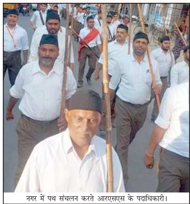
नगर में पथ संचलन करते आरएसएस के पदाधिकारी।

हम सभी को संकल्प लेना चाहिए कि हमें अपनी सनातन संस्कृति, सभ्यता और धर्म की रक्षा करते हुए स्वयं में गौरव और स्वाभिमान का अनुभव करना चाहिए। उद्बोधन के पश्चात स्वयंसेवकों द्वारा पथ संचलन किया गया।