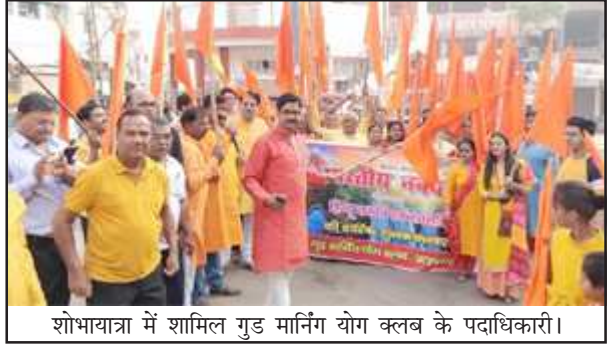
शोभायात्रा में शामिल गुड मार्निंग योग क्लब के पदाधिकारी।

इस शोभा यात्रा में गुड मार्निंग योग क्लब के सभी परिवारजन और ईस्ट मित्र इस कार्यक्रम में सम्मिलित हुए और नगर के सभी नागरिकों को हिन्दू नववर्ष की बधाई देते हुए यह शोभा यात्रा बाबागंज पार्क से होते हुए बाबागंज मार्ग से चैक घंटाघर तक उसके बाद घंटाघर से वापस अटल वाटिका पार्क बाबागंज में समापन किया गया।