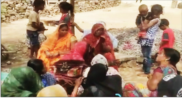
घटना के बाद रोते बिलखते परिजन व आसपास के लोग तथा वीरान पड़ा मृतका का घर