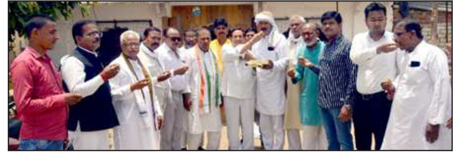
एक दूसरे को मिठाई खिलाकर खुशी का इजहार करते कांग्रेसी।

राजस्थान से प्रमोद तिवारी ने आज भरा पर्चा, समर्थकों में उत्साह