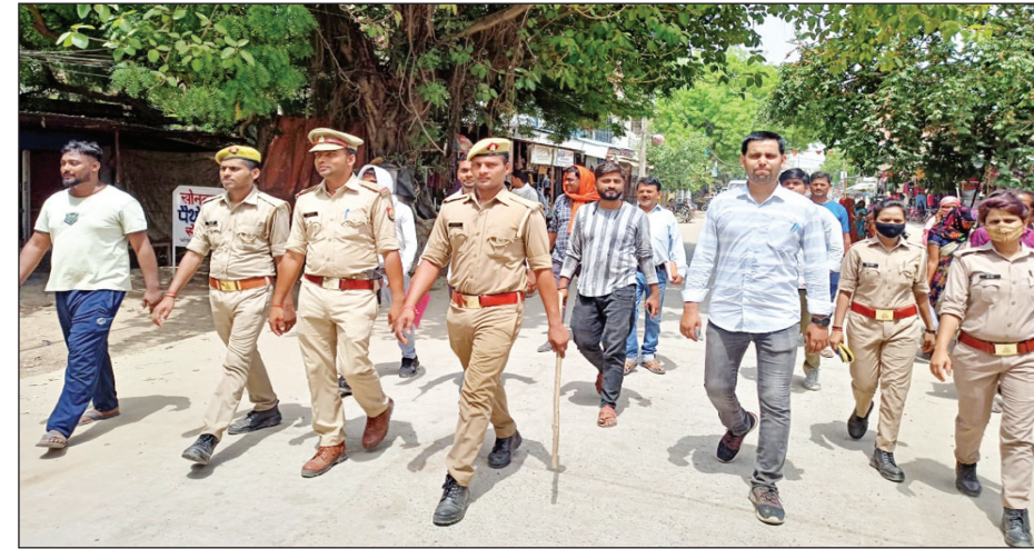
अतिक्रमण हटाने पहुंचे नगर पंचायत के अधिकारियों के साथ पुलिस बल