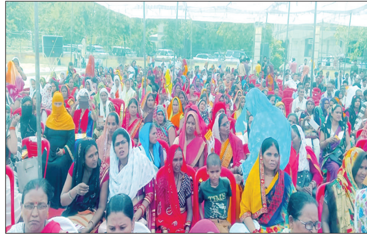
पीएम उद्घोषन को सुनने उमड़ी भीड़

प्रधानमंत्री ने विगत 08 वर्षों में गरीबों के कल्याण के लिए विभिन्न जनकल्याणकारी योजनाओं की शुरुआत की यथा-प्रधानमंत्री आवास योजना शहरी एवं ग्रामीण, प्रधानमंत्री किसान सम्मान निधि योजना, प्रधानमंत्री उज्वला योजना, जल जीवन मिशन, पोषण अभियान, प्रधानमंत्री मातृत्व वन्दना योजना, स्वस्थ भारत मिशन