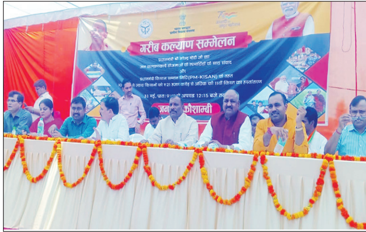
पीएम उद्घोषन कार्यक्रम में मंचासीन नेता और अधिकारी

कौशाम्बी। प्रधानमंत्री ने आज शिमला (हिमाचल प्रदेश) में आयोजित कार्यक्रम में विभिन्न जनकल्याणकारी योजनाओं के लाभार्थियों के साथ संवाद किया एवं प्रधानमंत्री किसान सम्मान निधि के तहत 10 करोड़ से ज्यादा किसानों को 21 हजार करोड़ से अधिक की 11वीं किस्त का बटन दबाकर हस्तान्तरण किया तथा प्रदेश के मुख्यमंत्री ने लोक भवन, लखनऊ में विभिन्न जनकल्याणकारी योजनाओं के लाभार्थियों से संवाद किया इसका सजीव प्रसारण कलेक्ट्रेट परिसर में आयोजित गरीब कल्याण सम्मेलन कार्यक्रम में किया गया व उपस्थित लाभार्थियों ने प्रधानमंत्री एवं मुख्यमंत्री के उद्घोषन को सुना प्रधानमंत्री द्वारा जनपद के प्रधानमंत्री किसान सम्मान निधि के पात्र लाभार्थियों को भी 11वीं किस्त का हस्तान्तरण किया गया सांसद विनोद सोनकर ने विभिन्न जनकल्याणकारी योजनाओं के लाभार्थियों को सम्बोधित करते हुए