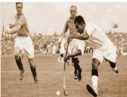
भारतीय टीम ने वर्ष 1928, 1932 और 1936 ओलंपिक में स्वर्ण पदक जीता था। उन्होंने 185 मैचों में भारत के लिए 570 गोल किए थे।

नई दिल्ली। प्रधान मंत्री नरेंद्र मोदी ने सोमवार को महान भारतीय हॉकी खिलाड़ी मेजर ध्यानचंद को उनकी जयंती पर श्रद्धांजलि अर्पित की और कहा कि हाल के वर्षों में भारतीय खिलाड़ियों ने पूरे विश्व में देश का परचम लहराया है। प्रधानमंत्री ने महान हॉकी खिलाड़ी मेजर ध्यानचंद की जयंती पर आज प्रतिवर्ष मनाए जाने वाले राष्ट्रीय खेल दिवस पर बधाई भी दी। पीएम मोदी ने ट्वीट किया, राष्ट्रीय खेल दिवस की बधाई और मेजर ध्यानचंद जी को उनकी जयंती पर श्रद्धांजलि। हाल के वर्ष खेलों के लिए बहुत अच्छे रहे हैं। यह सिलसिला जारी रहे। खेल पूरे भारत में लोकप्रियता हासिल करता रहे। आज पूरे देश में राष्ट्रीय खेल दिवस मनाया जा रहा है। इस दिन, लोगों को अपने पसंदीदा खेल खेलने के लिए अपने दिन में से कुछ समय निकालने और खुद को शारीरिक और मानसिक रूप से फिट रखने के लिए दैनिक जीवन में खेल खेलने की आदत डालने के लिए प्रोत्साहित किया जाता है। यह मेजर ध्यानचंद को श्रद्धांजलि के रूप में मनाया जाता है, जिन्हें हॉकी का