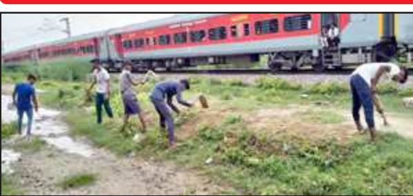
कच्चे रास्ते पर श्रमदान करते बच्चा बैंक के छात्र।

के साथ ही ग्रामीणों का भी इसी रास्ते से अधिक आना जाना होता है। बारिश से रास्ते में जलभराव है। जगह जगह गड्डे बन गए हैं। फ्री स्टडी सेंटर के बच्चे भी इसी