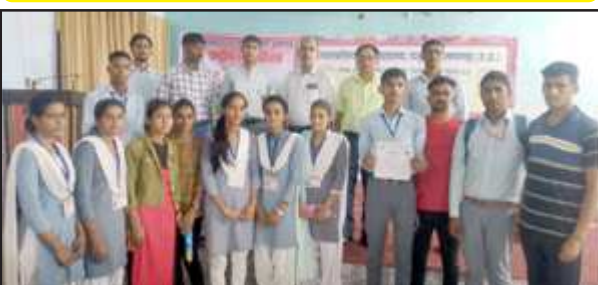
महाविद्यालय में मौजूद विजयी खिलाड़ी व शिक्षकगण।