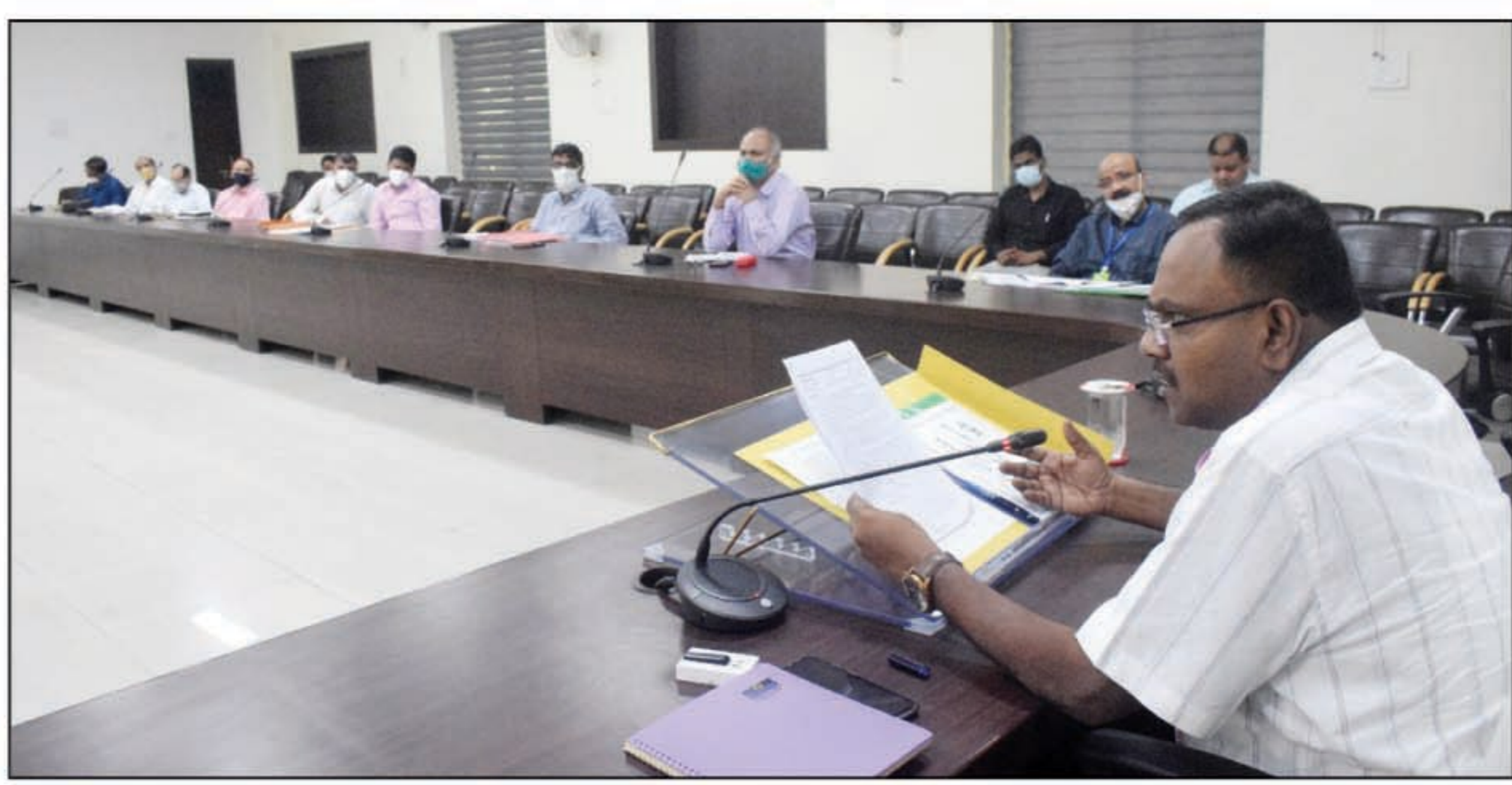
बैठक की अध्यक्षता करते मण्डलायुक्त