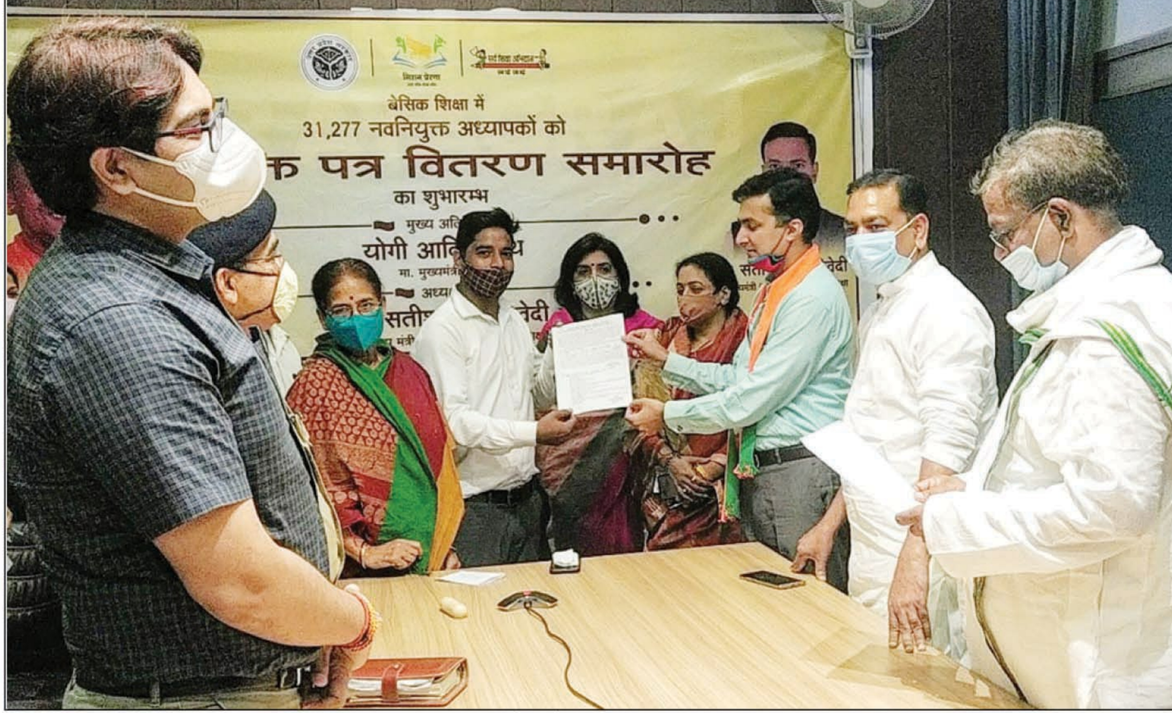
नव नियुक्त शिक्षकों को नियुक्ति पत्र प्रदान करते हुए