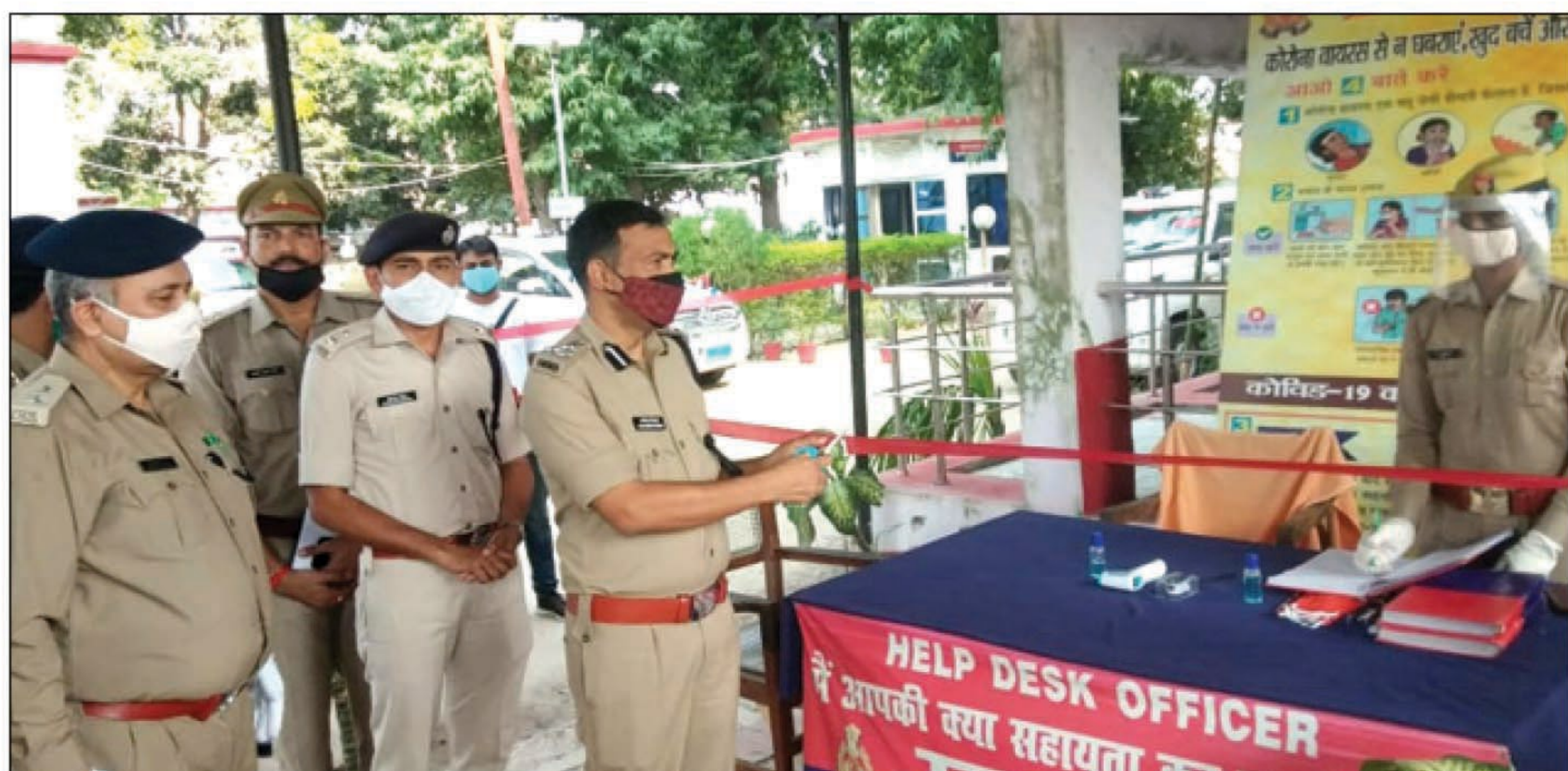
घूरपुर थाने में कोविड हेल्प डेस्क का फीता काटकर शुभारंभ करते एसएसपी