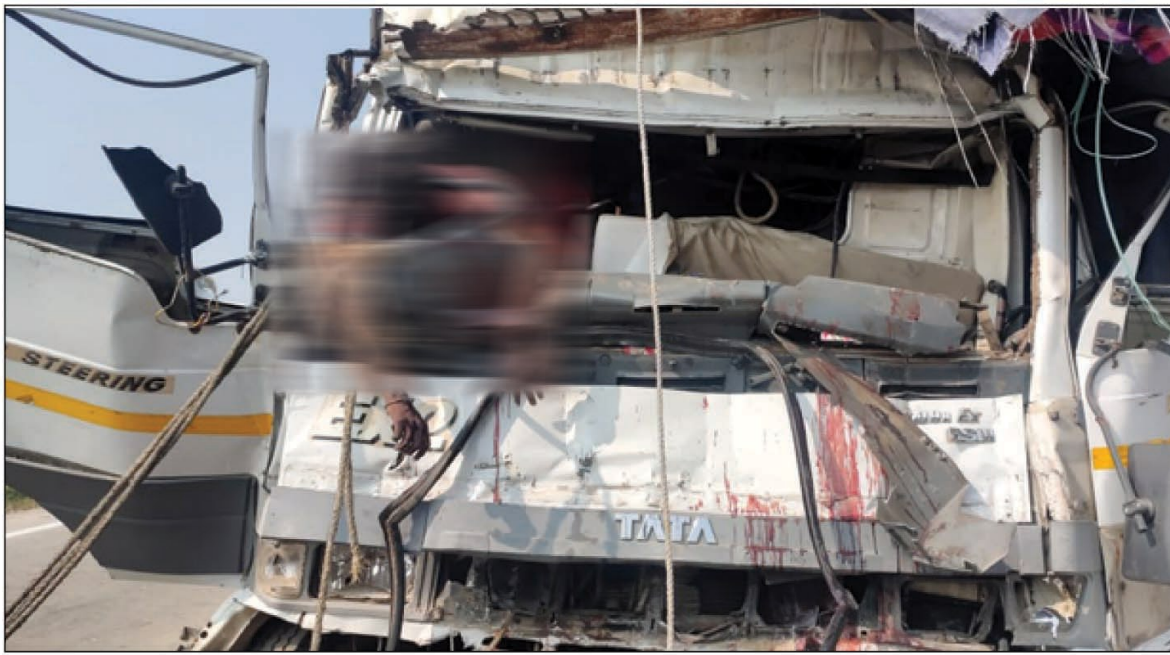
हादसे में क्षतिग्रस्त डीसीएम ट्रक