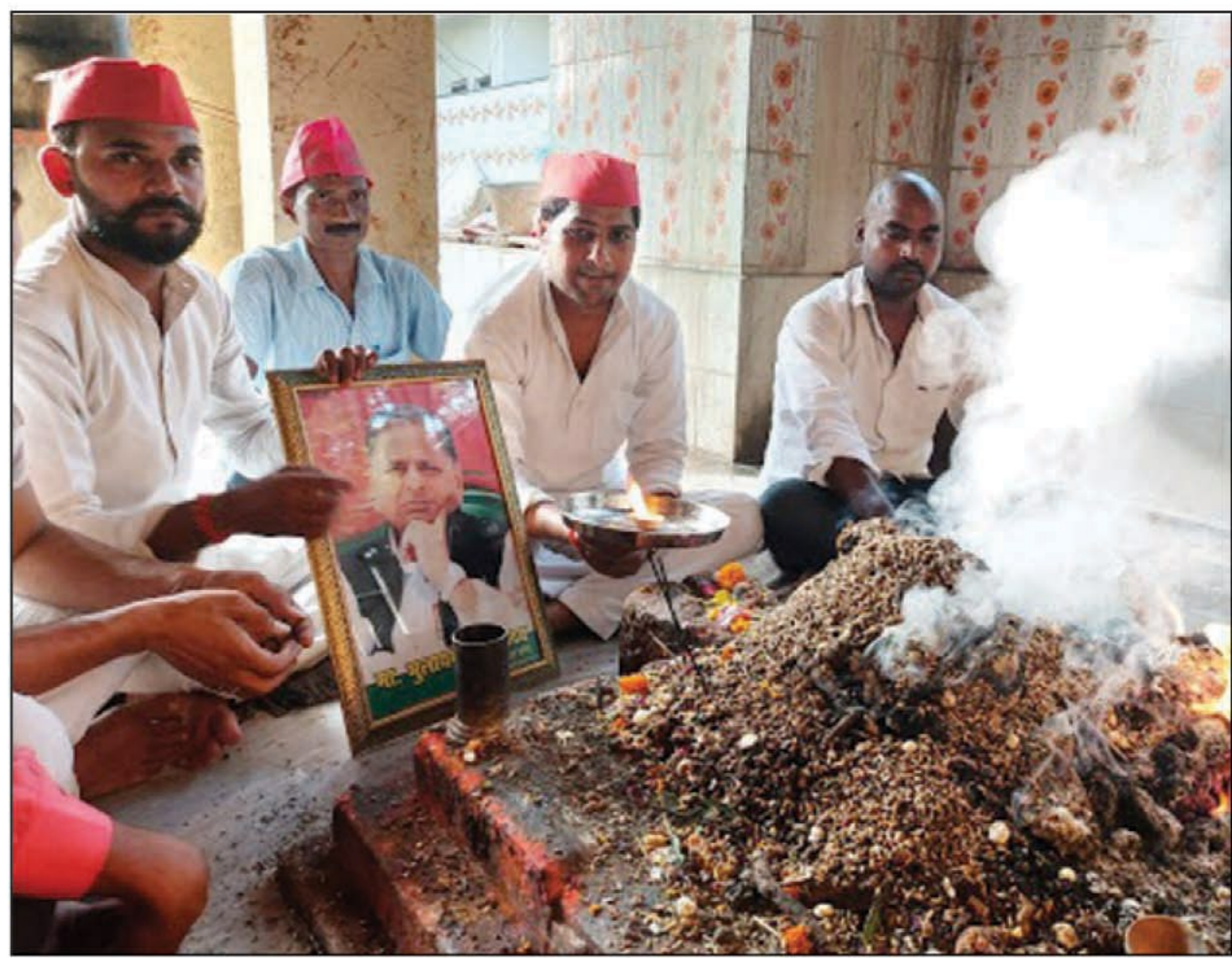
हवन पूजन करते सपा कार्यकर्ता