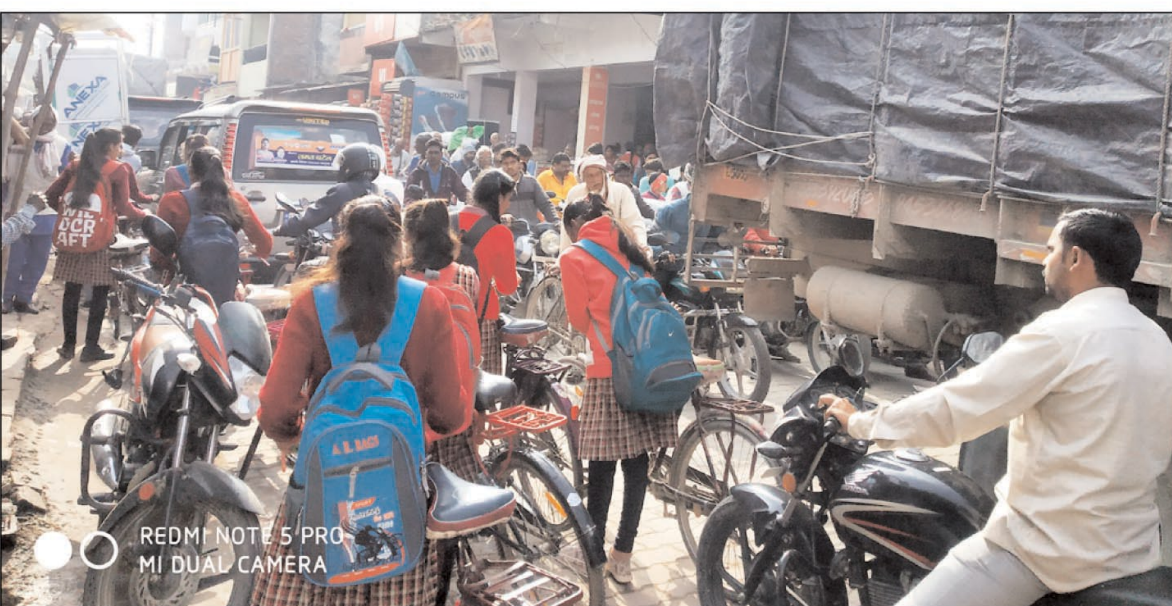
भीषण जाम में फंसे वाहन व छात्र

प्रतापपुर। जंघई हंडिया मुख्य मार्ग पर लगने वाले जाम से स्थानीय लोगों के अलावा दुकानदारों के लिए परेशानी का कारण बन गया है। हर दिन लगने वाले जाम के कारण आमजन तो परेशान है ही, मुख्य बाजार में दुकानें संचालित करने वाले दुकानदारों की दुकानदारी भी प्रभावित हो रही है।