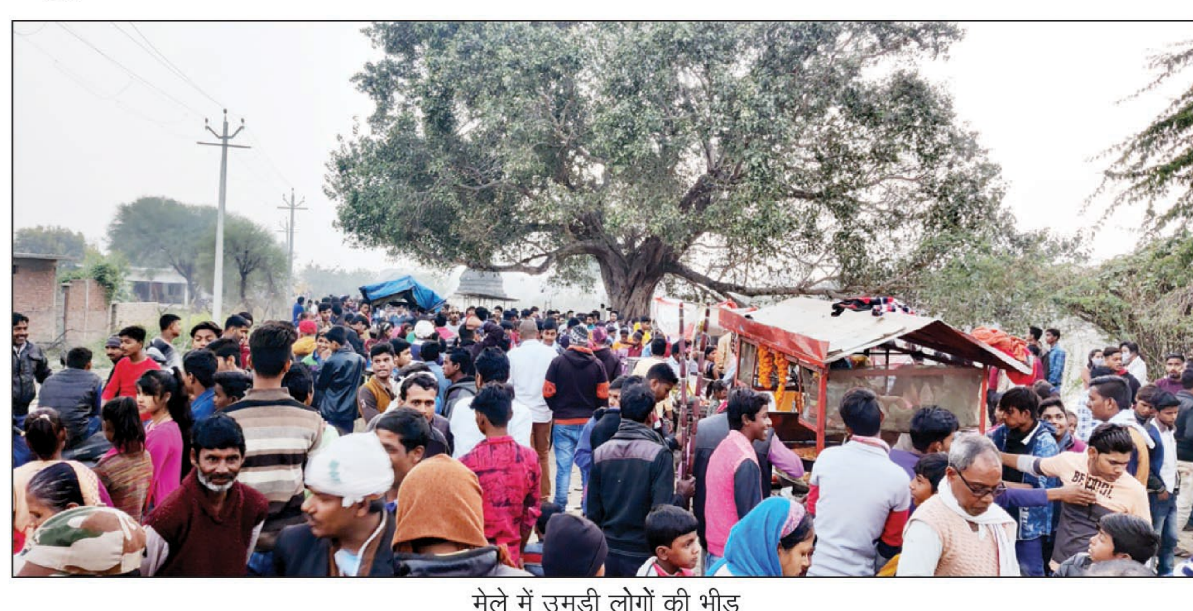
मेले में उमड़ी लोगों की भीड़

जारी। जारी क्षेत्र स्थित जारी गांव मुड़फूटे महादेव शिवमंदिर परिसर में परम्परागत पूसी तेरस मेले को लेकर तैयारियां पूरी हो चुकी है। दिन सोमवार को मंदिर परिसर में दूर-दूर से आये दुकानदारों की दुकानें सज चुकी है। वहीं बच्चों के लिए खेल तमाशा दिखाने वाले लोग भी मेले में पहुंच चुके हैं। मेले में होने वाली भीड़ के