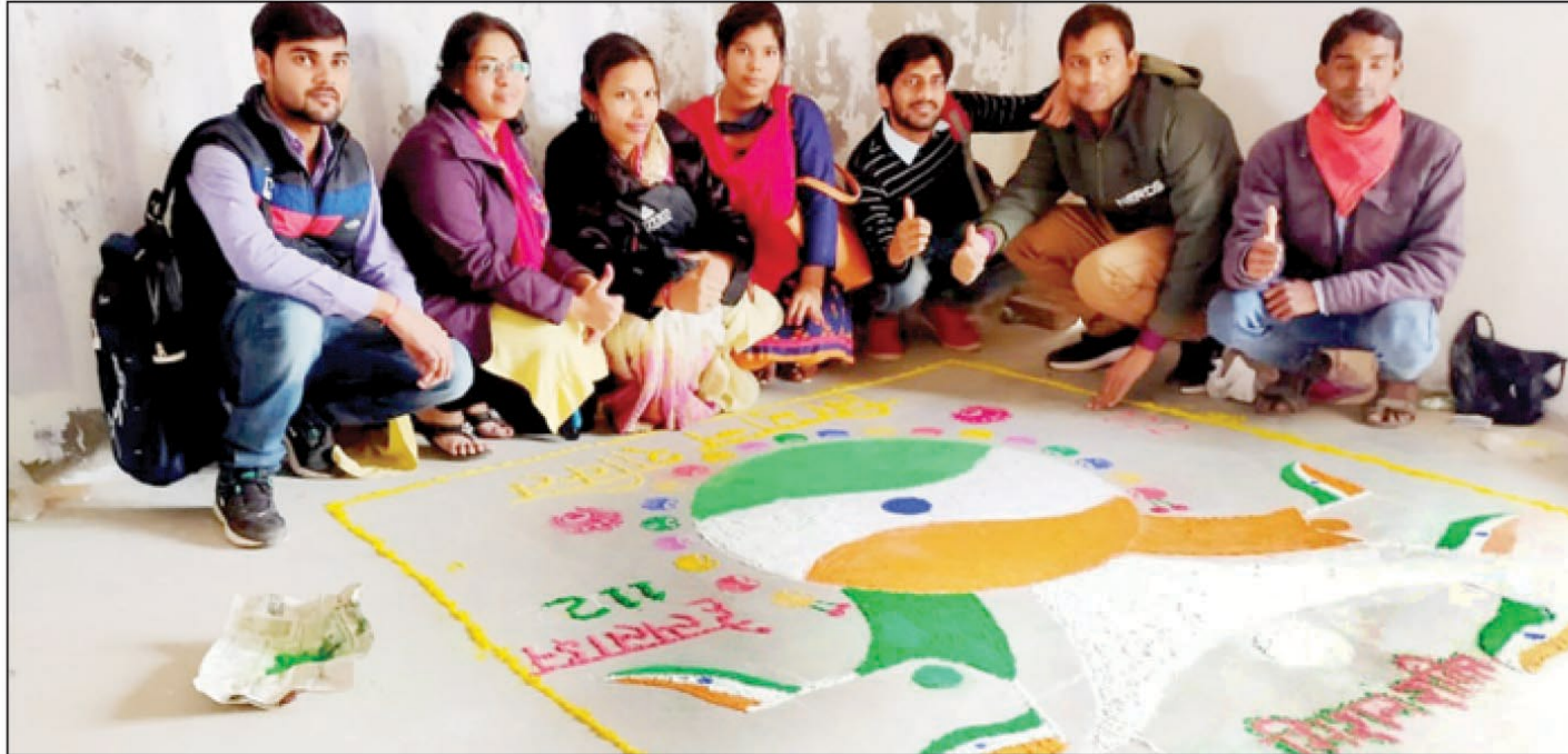
रंगोली के साथ छात्र-छात्राएं