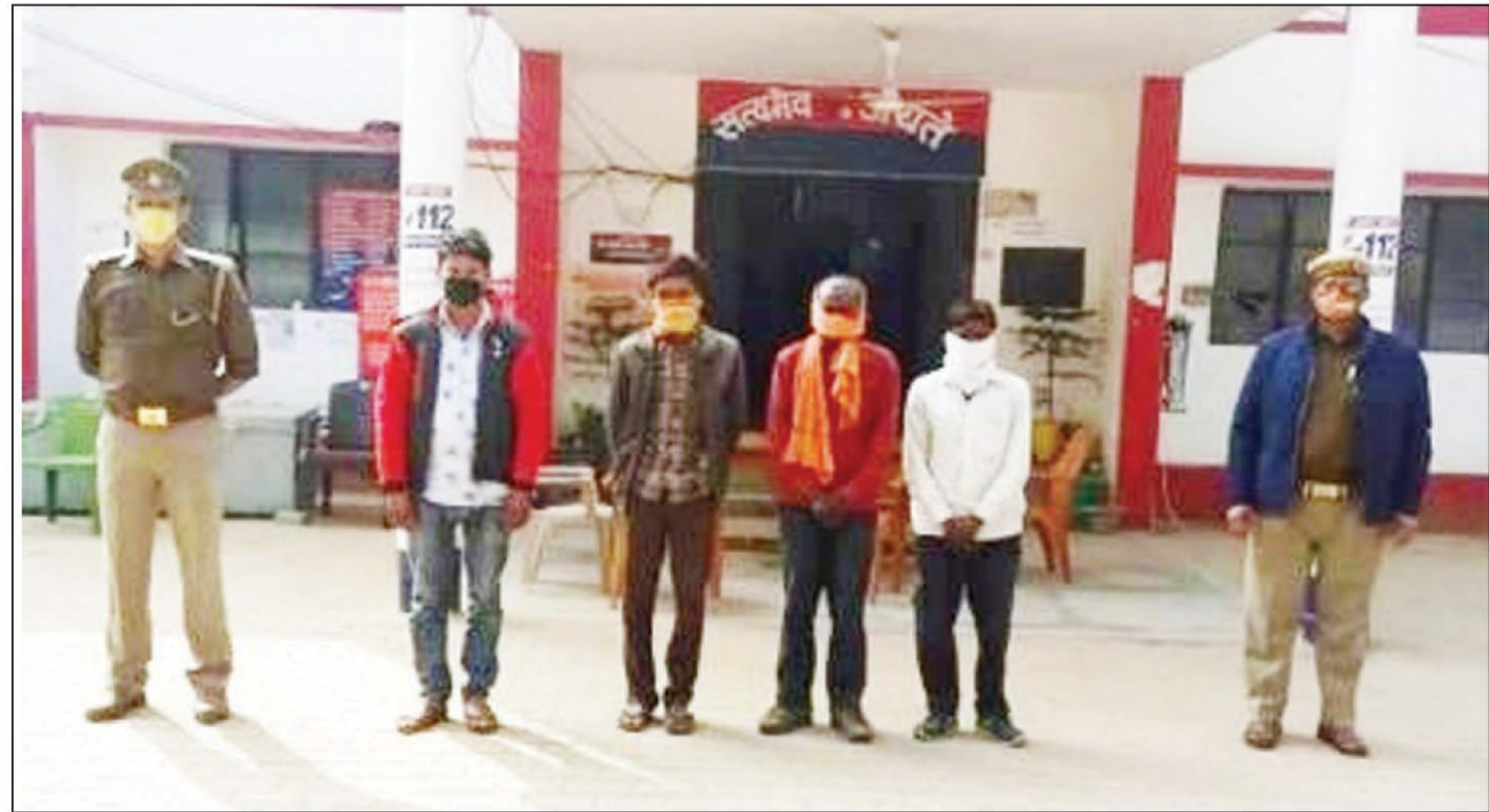
शंकरगढ़ पुलिस की गिरफ्त में जुआरी