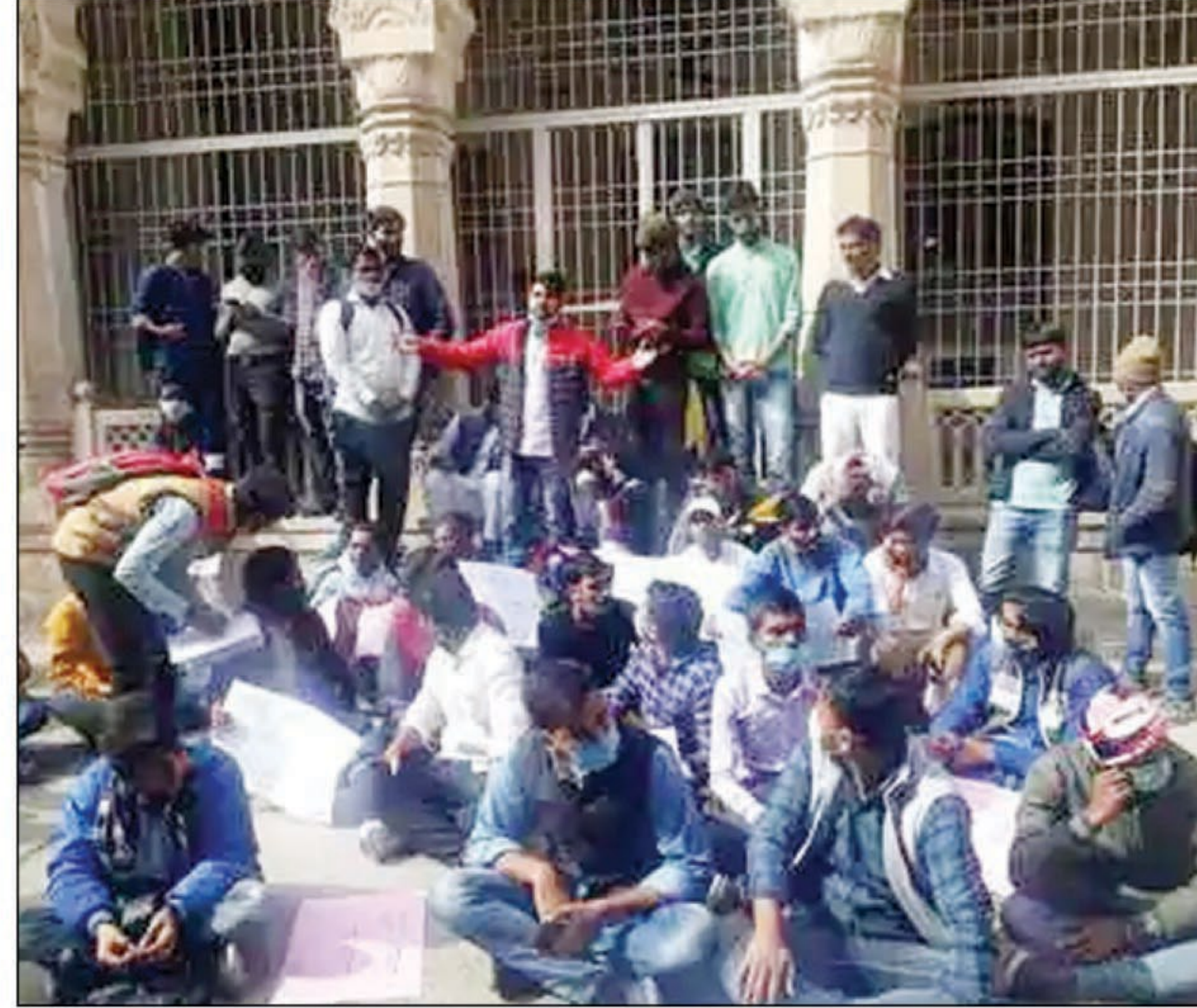
कुलपति कार्यालय का घेराव करते छात्र

प्रयागराज। इलाहाबाद विश्वविद्यालय को खोले जाने की मांग को लेकर सोमवार को छात्रों ने कुलपति कार्यालय का घेराव किया।