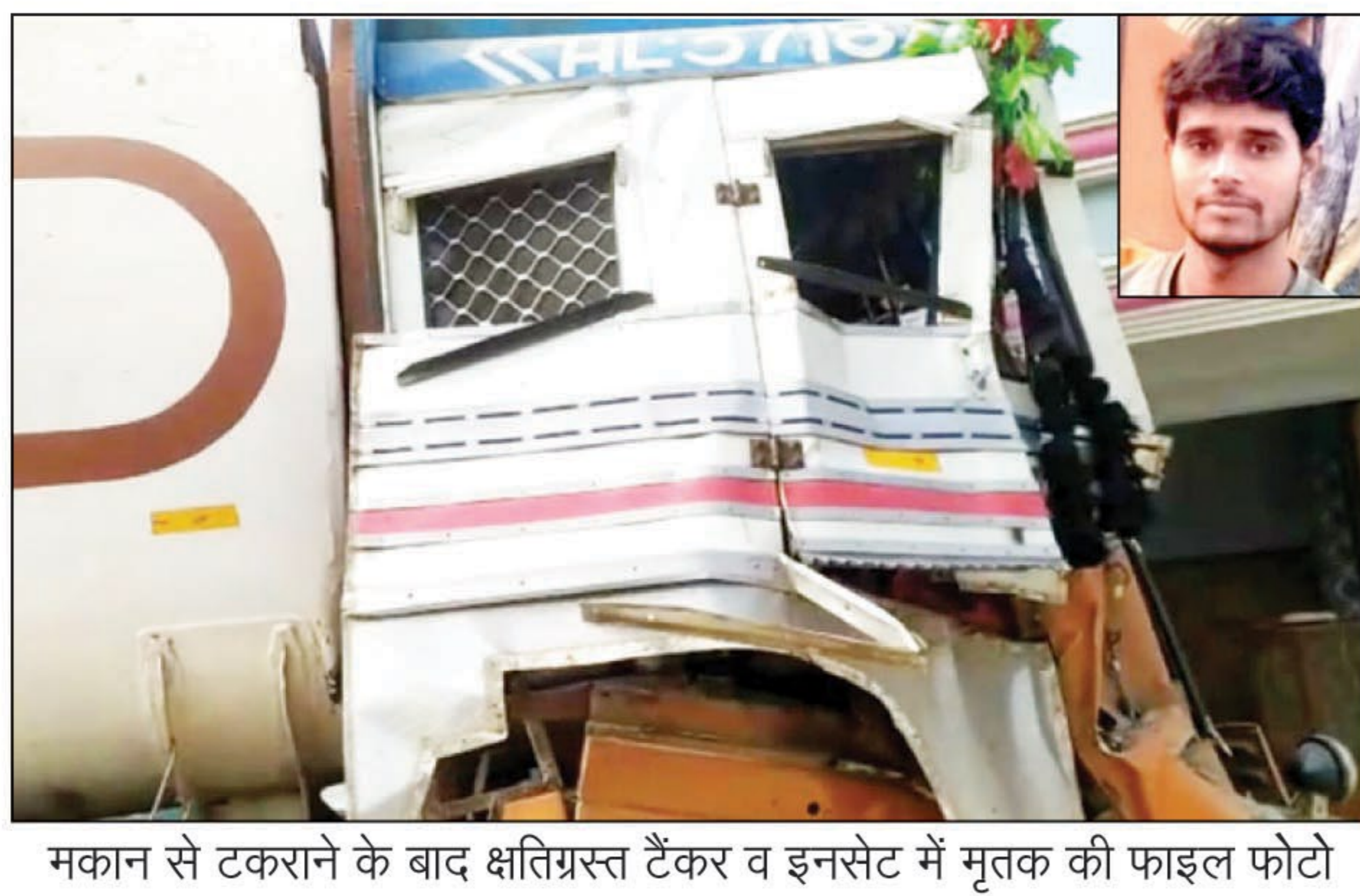
मकान से टकराने के बाद क्षतिग्रस्त टैकर व इनसेट में मृतक की फाइल फोटो

घूरपुर। इलाके के कांटी गांव स्थित हाईवे पर सोमवार की भोर बेकाबू टैकर ट्रैक्टर से भिड़ पास के एक पक्के मकान से भिड़ गया। जिससे टैकर का खलासी नीचे गिर गया और पिछले चक्के के नीचे आ गया। जिससे उसकी दर्दनाक मौत हो गई। चालक को गंभीर चोट आई है। पुलिस ने खलासी के शव को पोस्टमार्टम के लिए भेज दिया है। ट्रैक्टर ट्राली भी पलट गई। और मकान का अगला हिस्सा भी क्षतिग्रस्त