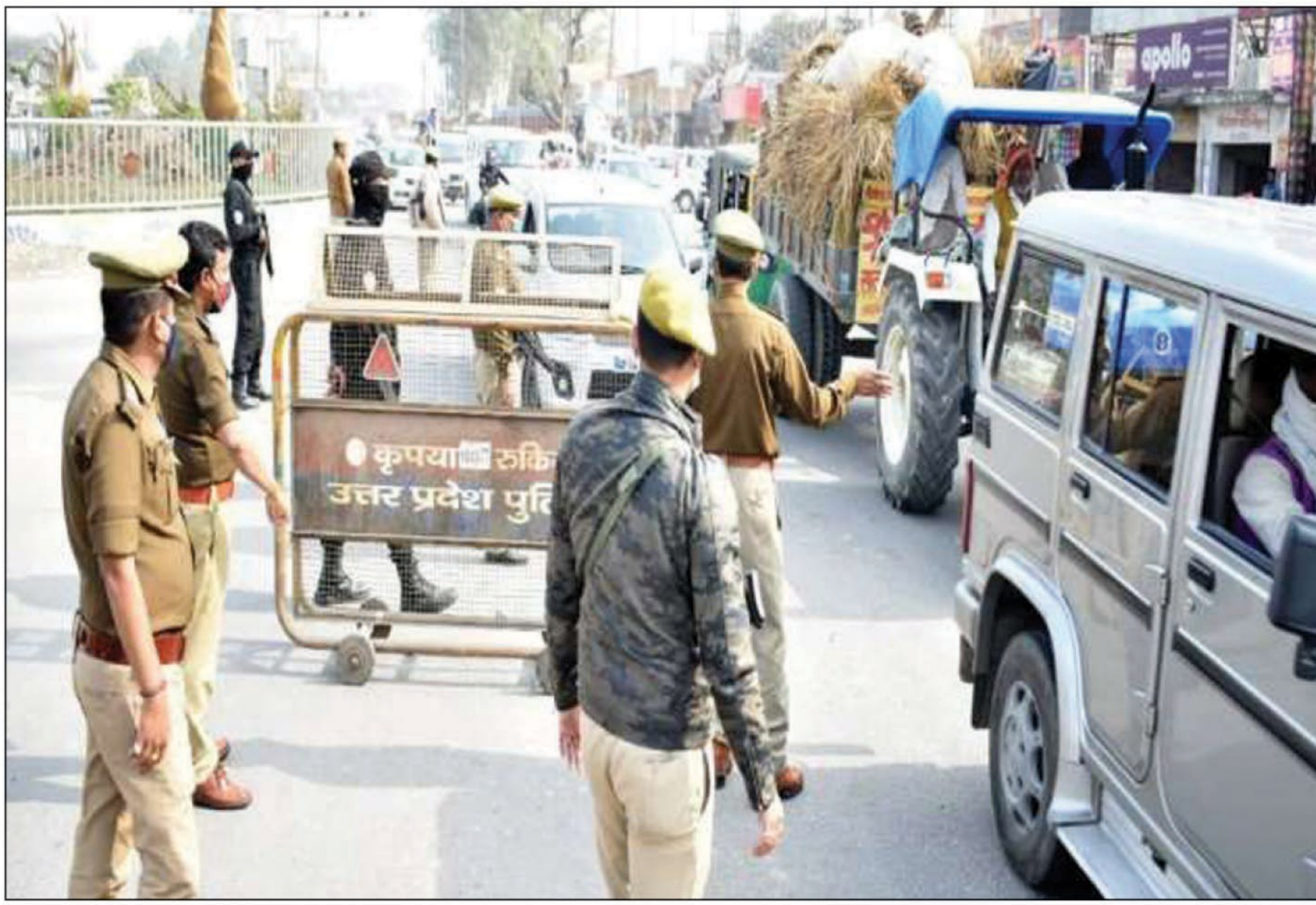
वाहनों की चेकिंग करती पुलिस

मकर संक्रांति को लेकर जिले में सुरक्षा को लेकर तगड़े बंदोबस्त किए गए हैं।