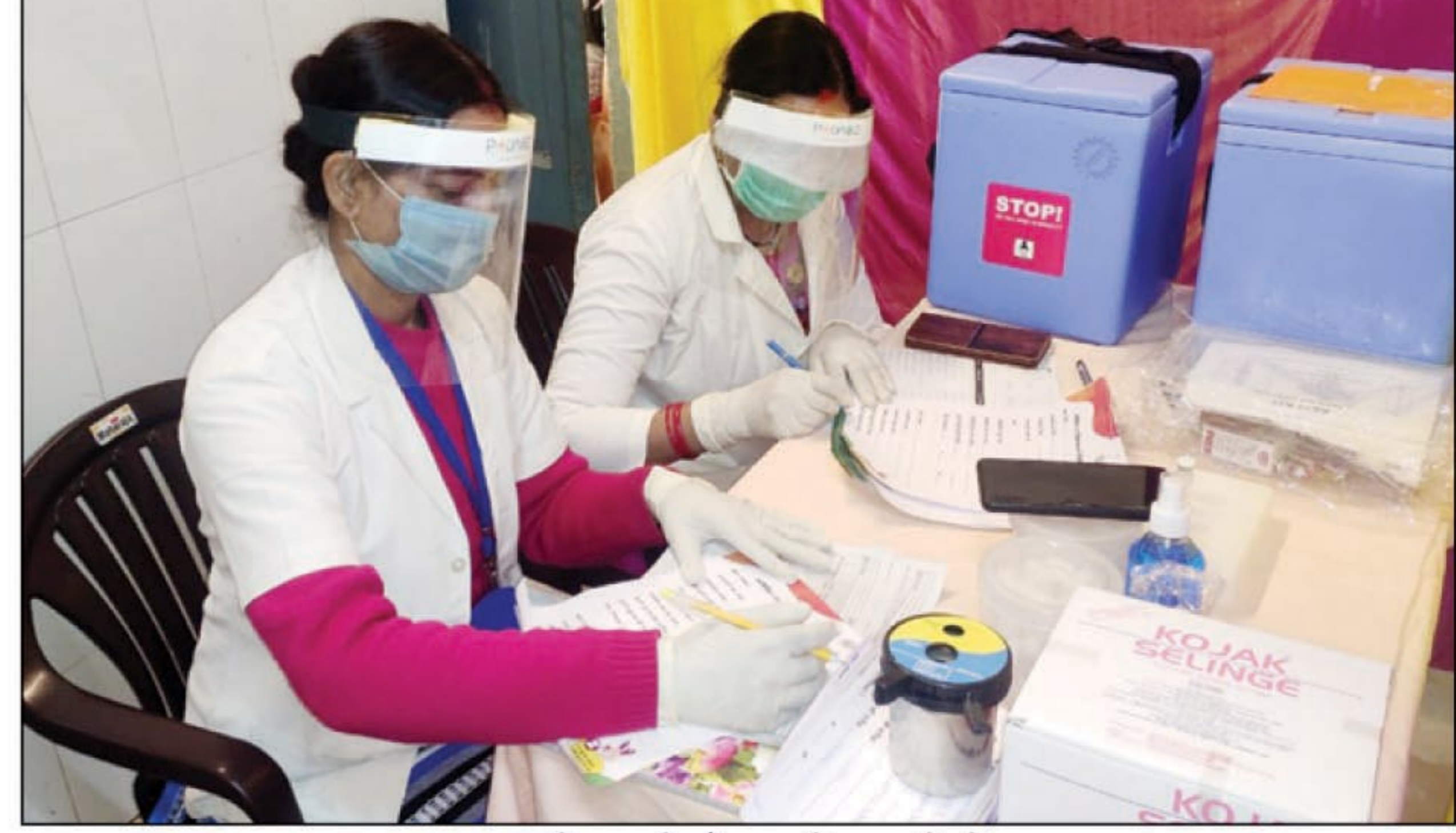
करछना सीएचसी में उपस्थित चिकित्सक

करछना। कोरोना वैक्सिन के बनाने जाने और सरकारी की मंशा के अनुरूप वैक्सिन को लगवाने की गाइड लाइन मिलते ही लोगों में उत्सुकता बढ़ गई है। कई क्रम में वैक्सिन को सुलभ करने की कार्ययोजना को लेकर सोमवार को सीएचसी करछना में 45 लोगों का