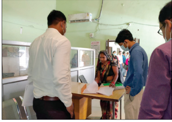
विकास खण्ड कार्यालय का जायजा लेते सीडीओ