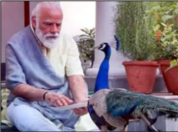
संघ शासित प्रदेशों के पर्यावरण अनुकूलन कार्यों को सहयोग तथा समर्थन दिया जा रहा है।

भूमिका निभा सकती है। गौर करें तो पर्यावरण और जलवायु परिवर्तन के मोर्चे पर भारत ने घरेलू स्तर पर ऐसी मिसाल कायम की है, जिसका आज विश्व अनुकरण कर रहा है। भारत आर्थिक विकास के क्रम में ग्रीन हाउस गैसों के उत्सर्जन में उत्तरोत्तर कमी लाने में कामयाब रहा है। भारत अपने 2005 में निर्धारित स्तर की तुलना में 2020 में जीडीपी की 'मिशन इंटेंसिटी' को 20 से 25 प्रतिशत तक करने की अपनी 2020 से पूर्व की प्रतिबद्धता को पार कर रहा है। इसके अतिरिक्त बीते सात वर्षों में भारत की स्थापित अक्षय ऊर्जा क्षमता में ढाई गुणा की वृद्धि हुई है, जिसके अंतर्गत सौर ऊर्जा क्षमता में 13 गुणा की वृद्धि दर्ज की गई है। केंद्र सरकार द्वारा 'राष्ट्रीय जलवायु परिवर्तन अनुकूलन कोष' के माध्यम से राज्यों और