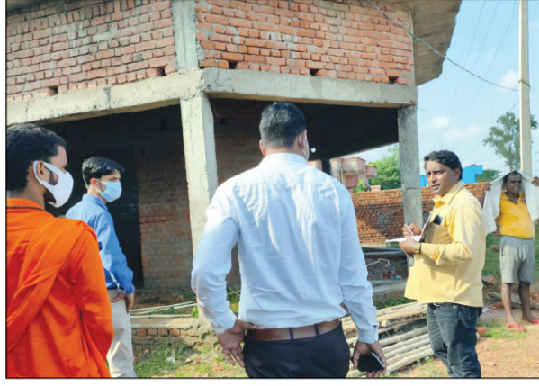
पंचायत भवन का निरीक्षण करते सीडीओ