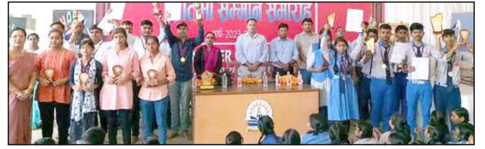
स्कूल प्रबंधन द्वारा सम्मानित मेधावीगण।