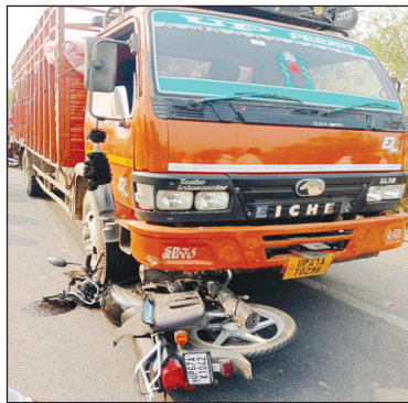
अखंड भारत संदेश

मांडा। दिधिया चौकी के अंतर्गत गौरी शंकर पेट्रोल पंप के समीप प्रयागराज-मिजापुर मुख्य मार्ग पर दो बाइक आमने सामने टकराने के बाद अनियंत्रित होकर एक ट्रक से भीड़ गया जिससे बाइक के परखच्चे उड़ गए। सूचना पर पहुंचे दिधिया पुलिस कार्मियों ने इलाज के लिए सीएचसी मांडा भेजा। गौरतलब हो कि मांडा थाना क्षेत्र के दिधिया पुलिस चौकी अंतर्गत प्रयागराज मिजापुर मुख्य मार्ग पर सोमवार को टिकरी गौरी शंकर पेट्रोल पंप