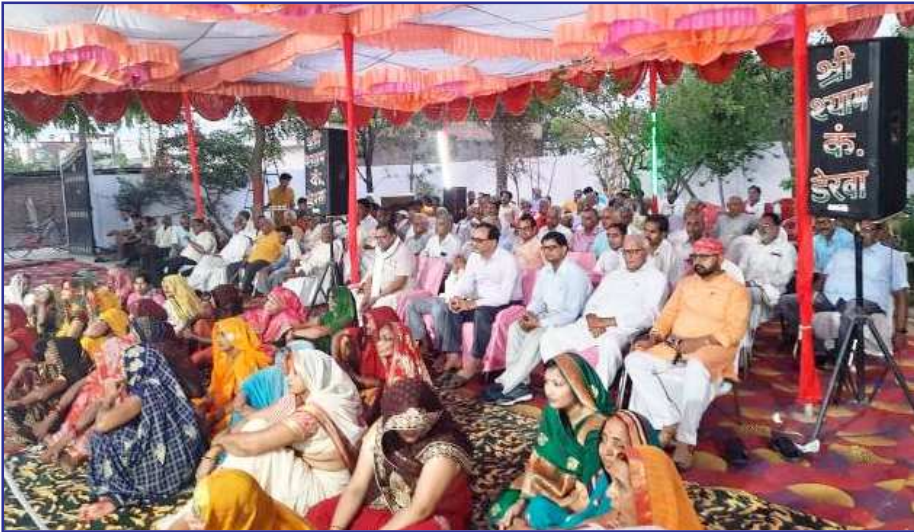
भागवत कथा का श्रवण करते श्रद्धालु।

मनीपुर में हो रही भागवत कथा में उमड़े श्रद्धालु