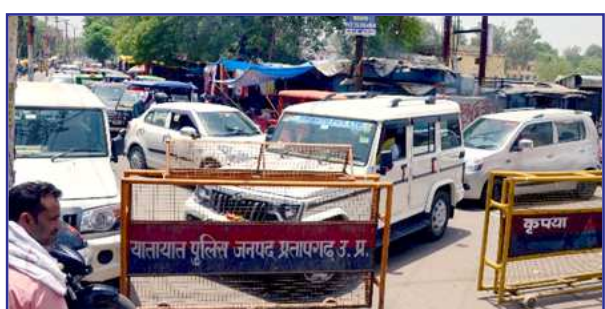
जिला महिला अस्पताल के सामने बेतरतीब ढंग से खड़े वाहन।

बता दें कि कार व बसों के आने से होने वाले जाम को