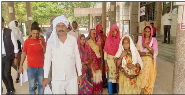
शिकायत लेकर कलेक्टर पहुंचे ग्रामीण

रकसौली गांव के खलिहान और तालाबी भूमि पर अवैध कब्जे को हटाने पर लेखपाल के पक्षपात पूर्ण रवैया से आक्रोशित ग्रामीणों ने लेखपाल को निलंबित करने की मांग की