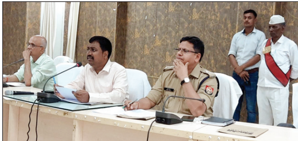
उपस्थित लोगों को निर्देशित करते डीएम

कौशाम्बी। जिलाधिकारी सुजीत कुमार की अध्यक्षता में खनन टास्क फोर्स की बैठक एण्टी भू-माफिया एवं पत्र सभा की भूमियों के विरुद्ध दर्ज वार्डों के निस्तारण की स्थिति तथा शराब माफियाओं के विरुद्ध कार्यवाही की स्थिति की समीक्षा की गई बैठक में जिलाधिकारी ने जिला खनन अधिकारी एओआर0टी0ओ0, उप जिलाधिकारियों एवं क्षेत्राधिकारियों को ओवरलोड वाहनों को पकड़कर सख्त कार्यवाही करने के निर्देश दिए। उन्होंने कहा कि ओवरलोड वाहनों को पकड़ने के लिए बनाये गए चेकपोस्ट पर विशेष निगरानी कर कार्यवाही सुनिश्चित किया जाय। जिलाधिकारी ने बैठक में उपस्थित खनन पट्टा संचालकों एवं ट्रांसपोर्टेरो की समस्याओं को सुना एवं सम्बन्धित अधिकारियों को आवश्यक