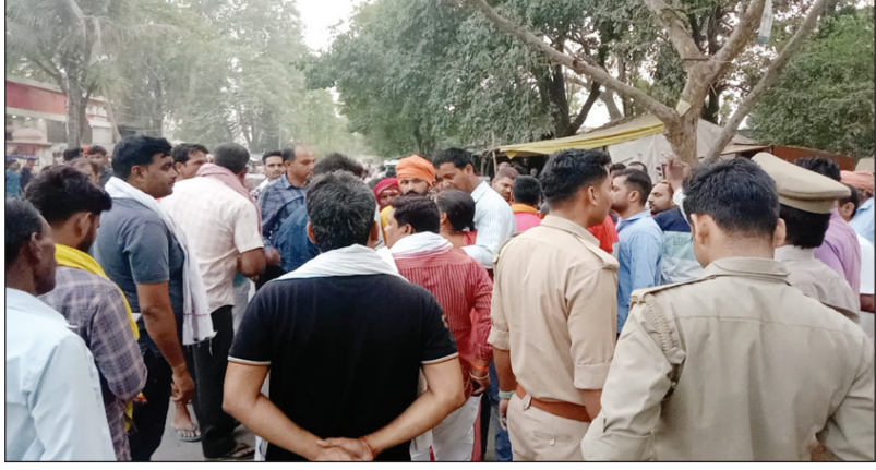
घटनास्थल पर लगी लोगों की भीड़