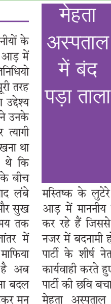
मेहता अस्पताल में बंद पड़ा ताला

कौशाम्बी। आजादी के 7 दशक बाद माननीयों के मन मस्तिष्क तेजी से बदल गए हैं सत्ता के आड़ में माननीय अब क्या क्या कर रहे हैं जनप्रतिनिधियों का नुमाइंदगी का पहले जो उद्देश्य था वह पूरी तरह से बदल चुका है पहले जनप्रतिनिधियों का उद्देश्य होता था कि लोग उन्हें सम्मान पूर्वक पहचाने उनके कार्यों को याद करें पहले चरित्रवान और त्यागी व्यक्ति ही जनप्रतिनिधि बनने का हौसला रखना था पहले के जनप्रतिनिधि कभी नहीं चाहते थे कि उनके दामन में दाग लग जाए और जनता के बीच उनकी किरकिरी हो जाए आजादी के बाद लंबे समय तक लोग गांधी जी का नाम लेते थे और सुख उठाते थे अटल जी का नाम भी लंबे समय तक लोग लेते थे और सुख भोगते थे कालांतर में अर्थात्क का जो खेल खेला जा रहा है वह माफिया गिरी धन बटोरने का साधन बन गया है अब माननीय में चरित्रवान और त्यागी की भावना बदल चुकी है और वह नुमाइंदगी का चोला ओढ़कर मन