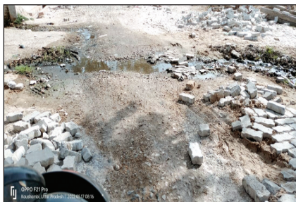
अर्ध निर्मित सड़क का दृश्य

अषाढा कौशाम्बी। मंझपुर तहसील क्षेत्र के अषाढा चौराहे से फैजीपुर जाने वाली सड़क का निर्माण एक वर्ष पूर्व शुरू हुआ था आधे अंधेरे काम पर 90% रकम सरकारी खजाने से ठेकेदारों को अवमुक्त कर दी गई है लेकिन सड़क का निर्माण करने के बजाय ठेकेदार काम छोड़कर भाग गए हैं जिससे राहगीरों को सड़क पर आने-जाने में दिक्कत होती है सड़क पर जगह-जगह इंटरलॉकिंग की ईंट और बालू के ढेर पड़े हुए हैं जिससे इस सड़क पर चार पहिया वाहन तो निकलना दूर दोपहिया वाहन साइकिल और पैदल चलना भी मुश्किल हो गया है कई बार इलाके के लोगों ने सड़क मरम्मत कराए जाने की मांग की लेकिन उसके बाद भी सड़क की मरम्मत नहीं हो सकी है विभागीय अधिकारी भी इस हेराफेरी को नजर अंदज करने में लगे हैं बताते चलें कि फैजी पुर और उसके आसपास बीच सड़क पर बालू का जगह जगह ढेर लगाकर ठेकेदार भाग