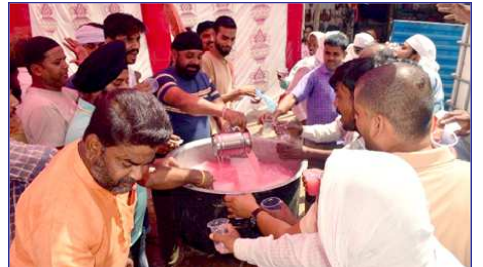
बुढ़वा मंगल पर राहगीरों को शरबत पिलाते आयोजकगण।

हुआ। जैसे इस बार शहर में व्याज कम जगह पर दिखाई दे रहे हैं। इस पर भी लोगों को आगे आना चाहिये।