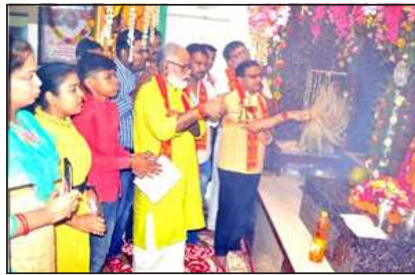
साई बाबा की आरती उतारते श्रद्धालु।