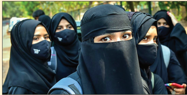
दो अहम बातें कही थीं। पहला- हिजाब इस्लाम का अनिवार्य हिस्सा नहीं है। दूसरा- स्टूडेंट्स स्कूल या कॉलेज की तयशुदा यूनिफॉर्म पहनने से इनकार नहीं कर सकते। हाईकोर्ट ने स्कूल-कॉलेज में

जाएगी। इसी साल मार्च में हाईकोर्ट ने कर्नाटक के स्कूल-कॉलेजों में हिजाब पहनने को लेकर अपना फैसला सुनाया था। कोर्ट ने हिजाब के समर्थन में मुस्लिम लड़कियों समेत दूसरे लोगों की तरफ से लगाई गई सभी 8 याचिकाएं खारिज कर दी थी, जिसके बाद याचिकाकर्ताओं ने अगले दिन यानी 15 मार्च को सुप्रीम कोर्ट में याचिका दायर की थी।