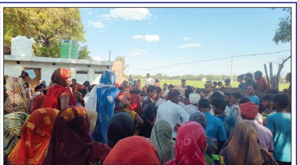
घटना के बाद मृतक के घर पहुंची पुलिस व मौके पर जुटी ग्रामीणों की भीड़