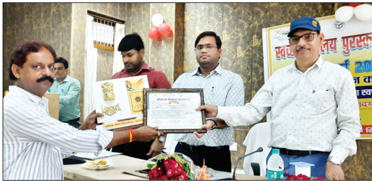
प्रमाण पत्र वितरित करते सीडीओ

सीडीओ ने प्रशस्ति पत्र देकर प्रधानाध्यापकों शिक्षकों, ग्राम प्रधानों एवं सचिव ग्राम पंचायतों को किया सम्मानित, विद्यालयों में आधारभूत सुविधाओं के विकास से बच्चों को शिक्षा के लिए मिल रहा अच्छा वातावरण