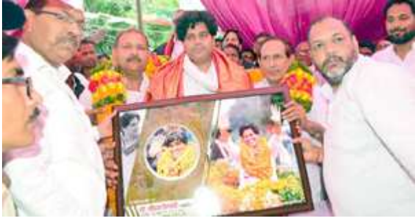
सांसद इमरान प्रतापगढ़ी का स्वागत करते कांग्रेसी।

हुए कांग्रेस नेतृत्व ने प्रतापगढ़ के एक वरिष्ठ कांग्रेस नेता प्रमोद तिवारी को राजस्थान से तथा मुझे युवा प्रत्याशी के रूप में महाराष्ट्र से राज्यसभा का चुनाव लड़ाया था।