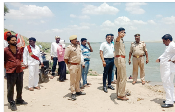
गंगा घाट का निरीक्षण करते अधिकारी

दिए। कार्यक्रम में कनाडा, अमरीका, ब्राजील, रूस, गयाना, सिंगापूर, यूरोप, ऑस्ट्रेलिया तथा भारत के विभिन्न प्रदेशों से आए हुए साधक तथा शिष्यगढ़ भारी संख्या में भाग लेकर शारीरिक मानसिक तथा आध्यात्मिक लाभ प्राप्त किए।