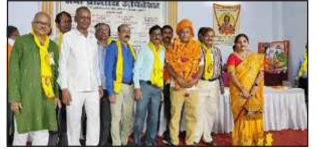
केसरवानी समाज के प्रांतीय पदाधिकारिणी।