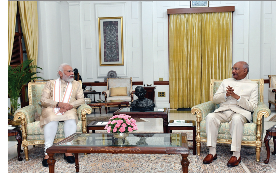
प्रधानमंत्री नरेंद्र मोदी राष्ट्रपति रामनाथ कोविंद से शिष्टाचार भेंट करते हुए।

नई दिल्ली: केंद्रीय मंत्रिमंडल ने कनेक्टिविटी प्रदान करने और गतिशीलता में सुधार के लिए तरंगा हिल-अंबाजी-अबू रोड नई रेल लाइन को मंजूरी दी है। इस परियोजना की अनुमानित लागत 2,798.16 करोड़ रुपये है और इसका काम 2026-27 तक पूरा हो जाएगा। प्रधानमंत्री नरेंद्र मोदी की अध्यक्षता में बुधवार को हुई केंद्रीय मंत्रिमंडल की बैठक में इन धार्मिक और पर्यटक स्थलों को रेल लाइन से जोड़ने के फैसले को मंजूरी प्रदान की गई। मंत्रिमंडल के फैसले की जानकारी देते हुए केंद्रीय मंत्री अनुराग ठाकुर ने बुधवार को कहा कि इन धार्मिक और सांस्कृतिक स्थलों को रेल से जोड़ने की मांग लम्बे समय से की जा रही थी। उन्होंने कहा कि 116.5 किलोमीटर की यह रेल लाइन अगले चार सालों में बनकर तैयार होगी। इस पर 2,798 करोड़ रुपये खर्च होंगे। इसके निर्माण के दौरान 40 लाख कार्यदिवस का रोजगार और स्वरोजगार सृजित होगा। यह परियोजना मौजूदा अहमदाबाद-आबू रोड रेलवे लाइन के लिए वैकल्पिक मार्ग भी प्रदान करेगी। उन्होंने कहा कि पर्यटन की दृष्टि से भी यह महत्वपूर्ण निर्णय है। नई रेल लाइन बनने से मेहसाणा पालनपुर रेल लाइन और डेडीकेटेड फ्रेट कॉरिडोर पर यातायात का दबाव कम होगा। इस रेल लाइन से गुजरात और राजस्थान के सीमांत क्षेत्रों में रहने वाले नागरिकों को नई सुविधा मिलेगी और दोनों राज्यों के महत्वपूर्ण स्थानों को इससे जोड़ा जाएगा।