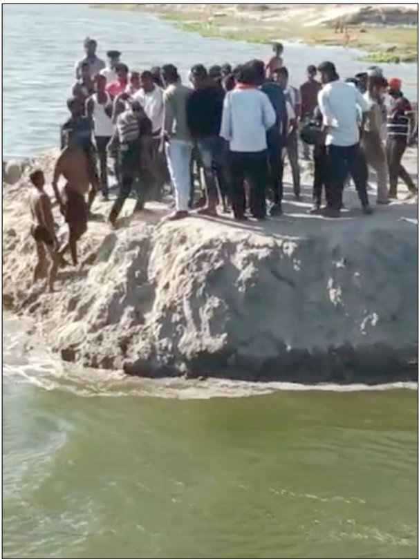
युवक के डूबने की जानकारी पर लगी गंगा स्नान करने वालों की भीड़