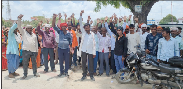
प्रदर्शन करते अकबराबाद गांव के आक्रोशित सैकड़ों ग्रामीण

प्रदर्शन कर रहे लोगों ने बताया कि पंचायत भवन के पास आराजी संख्या 376 में भी दबंगों ने कब्जा कर लिया है और चकबंदी हो जाए तो अवैध कब्जे की भूमि सार्वजनिक हो जाएगी लोगों ने कहा कि रास्ता और चक्रोड में कब्जा कर लिए जाने से आने-जाने की समस्या बनी हुई है ग्रामीणों का कहना है कि गांव में