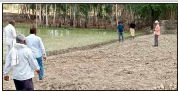
रायपुर तियाई झील की पैमाइश करते अधिकारी व कर्मचारी।

लालगंज, प्रतापगढ़। रायपुर तियाई झील के खोए हुए अस्तित्व को सवारने की कवायद शुरू हो गई। बुधवार को नायब तहसीलदार की अगुवाई में झील की पैमाइश की शुरूआत कर दी गई। झील को अतिक्रमण मुक्त कराने के लिए सीएम कार्यालय से डीएम को पत्र मिलते ही जिला प्रशासन सक्रिय नजर आने लगा।