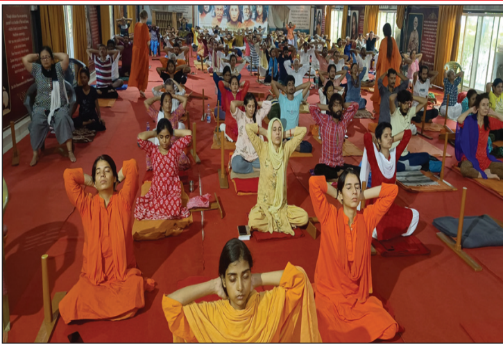
गुरु पूर्णिमा महोत्सव पर आए हुए समस्त साधक

तो अंधकार भी प्रकाश में उसी प्रकार विस्तार से स्पष्ट करते हुए उपस्थित प्रकाशित कोयले के संपर्क से काला बुझा कोयला ऐसी स्थिति में सच्चे ज्ञान की अनुभूति होती है। उक्त विचार अंतरराष्ट्रीय क्रियायोग गुरुदेव स्वामी श्री