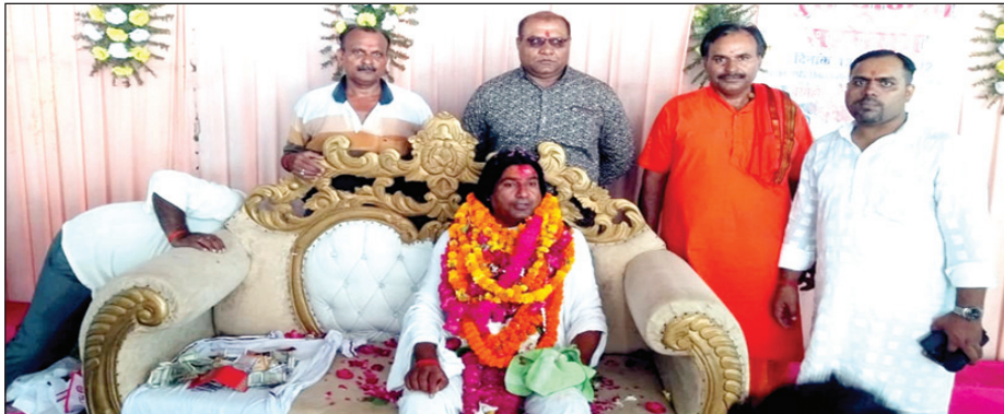
गुरु के समक्ष उपस्थित भक्त