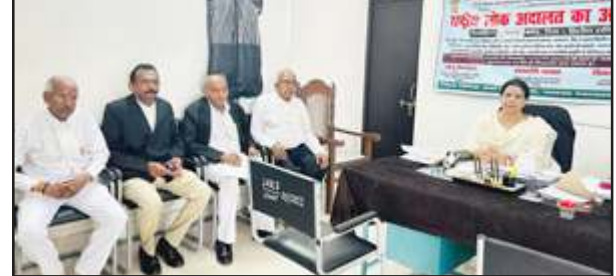
अधिवक्ताओं को वादों को अधिक से अधिक संख्या में सुलह-समझौता के लिए अपील की। इस मौके पर