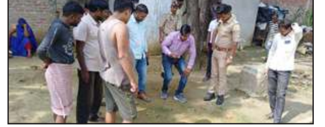
जंगली जानवर के पैर के निशान की जांच करती टीम।

प्रतापगढ़। शहर के समीप कोतवाली क्षेत्र के गोपालपुर पसियान गांव में बीती रात एक जंगली जानवर ने घर के बाहर बंधी एक बकरी पर हमला कर उसे खा लिया और दूसरी बकरी को हमलाकर घायल कर दिया। बकरियों के चिल्लाने पर घरवाले उठे और बाहर निकले, तब जंगली जानवर भाग गया। घटना की सूचना पर गांव वाले तथा वन विभाग की टीम पहुंची और घटना की तहकीकात करने में जुट गई है।