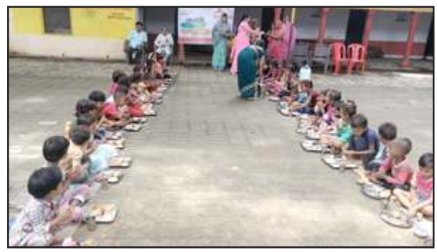
व खीर खिलाया गया। इसके बाद बच्चों को खिलौने वितरित किए गए। जनपद की समस्त बाल विकास परियोजनाओं में 5-5 आंगनवाडी केन्द्रों में सामुदायिक सहभागिता से बाल भोग उत्सव का आयोजन किया गया। जिसमें आंगनवाडी कार्यकर्त्री

चित्रकूट। राष्ट्रीय पोषण माह सितम्बर 2024 के दौरान मुख्य विकास अधिकारी अमृतपाल कोर के निर्देशानुसार जनपद के आंगनवाडी केन्द्रों पर सामुदायिक सहभागिता से बाल भोग उत्सव का आयोजन किया गया। कार्यक्रम का आयोजन जिला कार्यक्रम अधिकारी पीडी विश्वकर्मा के नेतृत्व में विकास खण्ड कर्मी के आंगनवाडी केन्द्र शिवरामपुर में आयोजित किया गया। केन्द्र पर ग्राम प्रधान की उपस्थिति में लगभग 60 बच्चों को पूड़ी-सब्जी