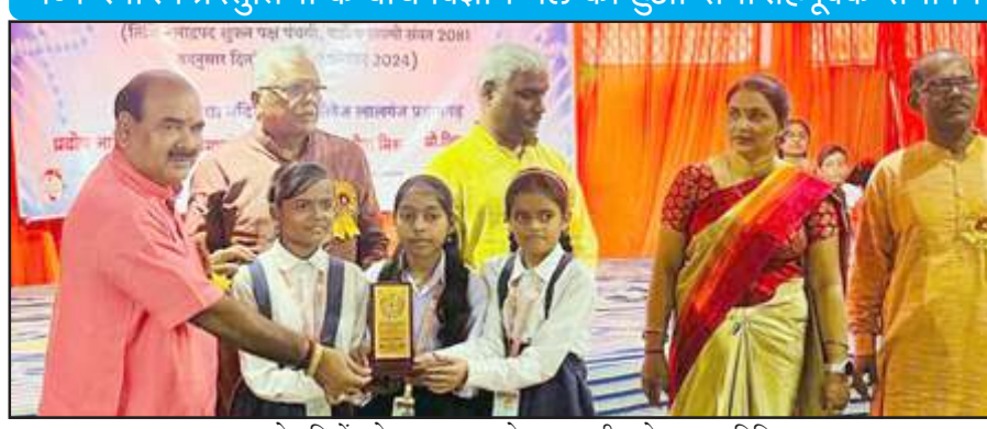
सफल मेधावियों को पुरस्कृत करते एमएलसी उमेश व अतिथिगण।

भव्य रंगारंग प्रस्तुतियों के बीच विज्ञान मेले का हुआ समारोहपूर्वक समापन