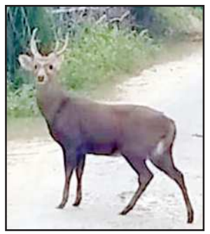
रिजर्व जंगल में घूमते हिरण।

लालगंज, प्रतापगढ़। दुर्लभ प्रजाति के हिरणों को कालापुर व गौखाडी के रिजर्व जंगल का भौगोलिक वातावरण खूब रास आ रहा है। हिरणों की चहल-कदमी से वन की सुंदरता में चार चांद लग गए हैं। वहीं जानकारी के बावजूद वन विभाग इनके संरक्षण के लिए कोई पहल करता दिखाई नहीं दे रहा है।