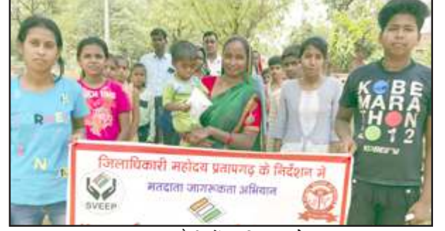
मतदाता रैली में शामिल बच्चे।

इस लोकतंत्र पर्व में हम सबको अपनी मताधिकार का प्रयोग करना चाहिए। जिससे अपने देश के विकास के लिए एक सशक्त सरकार बना सके। हम सबको आने वाले 25 मई 2024 दिन शनिवार को इस चुनाव में बढ़-चढ़कर हिस्सा लेना चाहिए