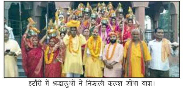
इटौरी में श्रद्धालुओं ने निकाली कलश शोभा यात्रा।

सिर पर आस्था का कलश लिये बड़ी संख्या में शामिल महिला पुरुष श्रद्धालु कुलदेवी मंदिर नरदेव नथ धाम श्रीमहाकाली धाम होते हुए ऊँ बूढ़ेश्वरनाथ धाम पहुंचे। यहां श्रद्धालुओं ने विधिविधान से दर्शन