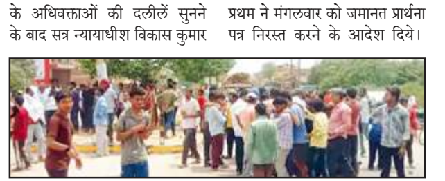
जाम लगाये छात्र।