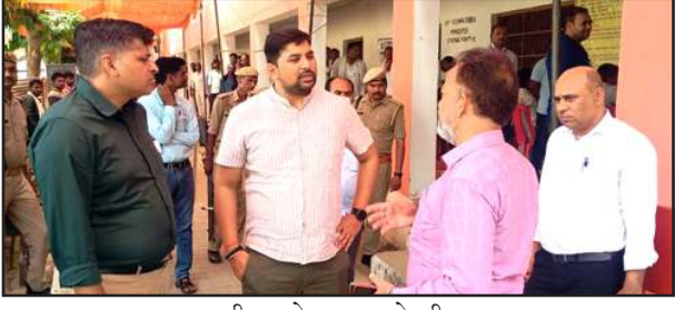
एसडीएम से बात करते डीएम।

अधिकारी ने सहायक रिटर्निंग ऑफिसर कर्मी/मऊ-मानिकपुर को निर्देश दिए की राजनैतिक दलों के पदाधिकारियों को रेंडम ईवीएम