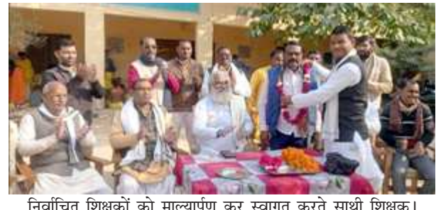
निर्वाचित शिक्षकों को माल्यापण कर स्वागत करते साथी शिक्षक।