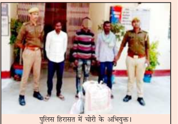
पुलिस हिरासत में चोरी के अभियुक्त।

कौशाम्बी। 28 व 29 नवम्बर 2022 की रात्रि को बरई बंधवा पंचायत भवन में अज्ञात चोरों द्वारा चोरी की घटना कारित की गयी थी जिसके सम्बन्ध में थाना करारी पर मुकदमा पंजीकृत कर घटना के शीघ्र अनावरण हेतु पुलिस अधीक्षक द्वारा निर्देशित किया गया था। इस क्रम में अपर पुलिस अधीक्षक के मार्गदर्शन एवं क्षेत्राधिकारी मंझनपुर के कुशल पर्यवेक्षण में थाना करारी पुलिस बल द्वारा मुखबिर् की सूचना पर प्रकाश में