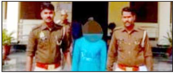
पुलिस हिरासत में इनामी अभियुक्त।