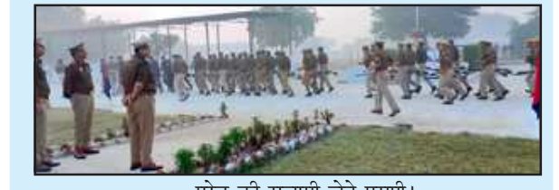
परेड की सलामी लेते एसपी।

पुलिसकर्मियों को साफ-सुथरी एवं निर्धारित वर्दी धारण करने तथा नियमानुसार टर्नआउट मेटेन करने हेतु निर्देश