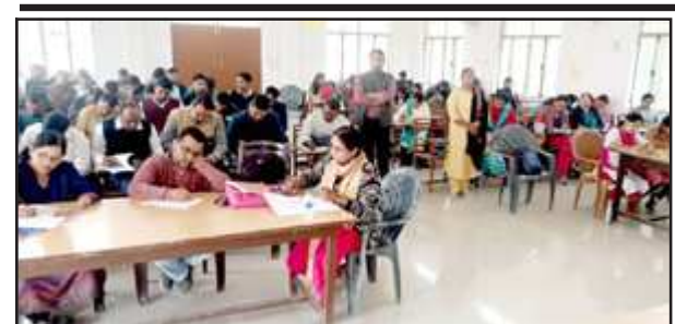
नेट परीक्षा में शामिल परीक्षार्थी।

जनपद के सभी 1092 परिषदीय स्कूलों में नामांकन के सापेक्ष 80 प्रतिशत छात्रों की परीक्षा में रही उपस्थिति