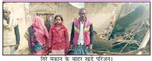
गिरे मकान के बाहर खड़े परिजन।

तमाम प्रयास के बाद भी झोपड़पट्टी में रहने वाले गरीबों को नहीं मिल सका प्रधानमंत्री आवास का लाभ