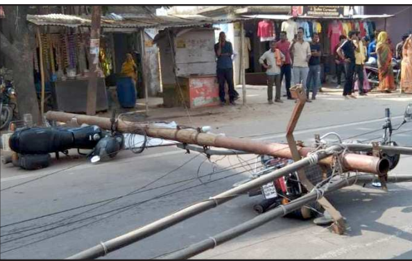
जर्जर विद्युत पोल गिरने से उसके नीचे दबी मोटरसाइकिल।

लालगंज में प्रतापगढ़ रोड पर गिरे चार खंभे, मची अफरा-तफरी