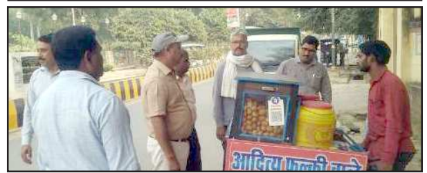
ठेले वाले का चालान काटते नगर पालिका अधिकारी।

जिलाधिकारी के आदेश पर अम्बेडकर चैराहे से डाक बंगले तक चल रहा है यह अभियान