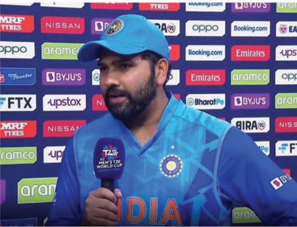
आसान नहीं था। एक युवा गेंदबाज का इस तरह की भूमिका निभाना आसान नहीं है लेकिन हमने उसे तैयार किया।' उन्होंने

हमने उससे डेथ ओवरों में गेंदबाजी करने के लिए कहा। बुमराह टीम में नहीं है और ऐसे में यह काम किसी के लिए भी रहा है तो मैं उसका समर्थन करता हूँ। हमारे पास शमी और अर्शदीप विकल्प थे।' रोहित ने मैच के निभाना आसान नहीं है लेकिन हमने उसे तैयार किया।' उन्होंने