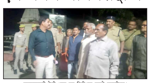
ज्वालामुखी देवी धाम का निरीक्षण करते एसडीएम।

इसके पूर्व भी एक बैठक कुंडा तहसील परिसर में बीते 28 अक्टूबर को आयोजित की गई थी, जिसमें सभी संबंधित विभागों को तैयारियों के लिए दिशा निर्देश दिया गया था। थाना परिसर की बैठक में मेले के बारे में विस्तार पूर्वक चर्चा की गई। जिसमें विशेष रूप से विद्युत विभाग, नगर पंचायत विभाग, जल निगम व सड़क विभाग द्वारा की जा रही कार्रवाई की जानकारी ली गई। इसके