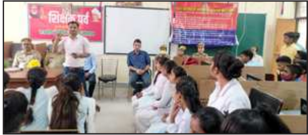
साइबर अपराध से बचाव की जानकारी देती पुलिस।

साइबर अपराध से सम्बन्धित अपराध के बारे में कॉलेज के छात्र छात्राओं व अध्यापकों को बताया व जागरूक किया गया साथ ही गृह मंत्रालय भारत सरकार द्वारा