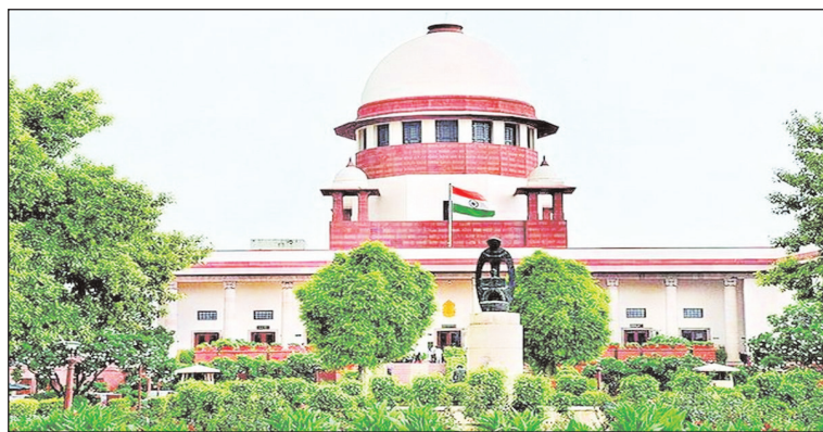
दाखिल की गई याचिका पर कोर्ट ने केंद्र सरकार और आरबीआई से विस्तृत हलफनामा दाखिल करने को कहा। दोनों ने