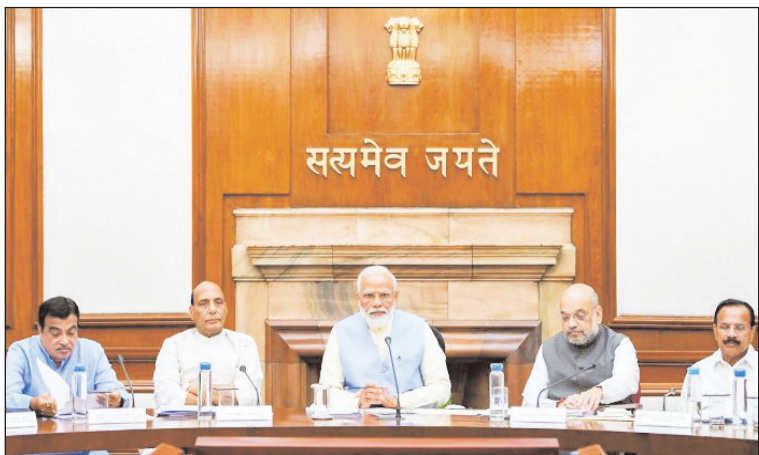
परिचालन के क्षेत्र में ऐसी वस्तुओं की कोई कमी न हो।

नई दिल्ली: कैबिनेट ने वित्तीय वर्ष 2021-22 के लिए रेलवे कर्मचारियों को 78 दिनों के बराबर उत्पादकता से जुड़े बोनस के भुगतान को भी मंजूरी दी। रेलवे के 11.27 लाख कर्मचारियों को 1,832 करोड़ रुपये का प्रोडक्टिविटी लिंकड बोनस दिया जाएगा। यह 78 दिनों का बोनस होगा और इसकी अधिकतम सीमा 17,951 रुपये होगी। कैबिनेट की बैठक में बुधवार को बताया गया कि वित्तीय वर्ष 2021-22 के लिए आरपीएफ/आरपीएसएफ कर्मियों को छोड़कर अराजपत्रित रेल कर्मचारियों को 78 दिनों के वेतन के बराबर उत्पादकता-लिंकड बोनस (पीएलबी) का भुगतान किया जाएगा।