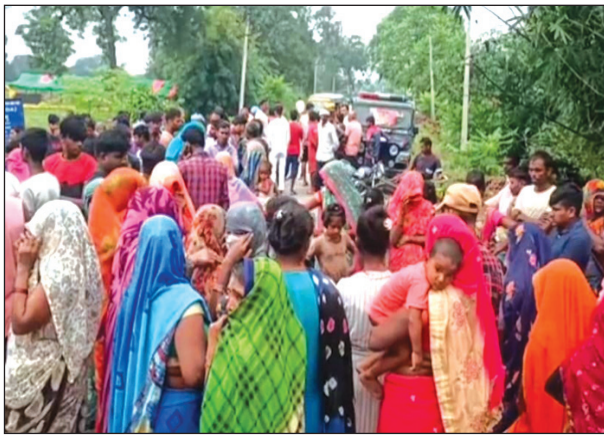
मासूम की मौत के बाद लगी भीड़

अड्डवा कौशाम्बी। सैनी कोतवाली क्षेत्र के रामपुर धमावा के पास अनियंत्रित ट्रक ने सड़क किनारे खड़े एक मासूम को रौंद दिया है हादसे में मासूम की दर्दनाक मौत हो गई है मौत की जानकारी मिलते ही ग्रामीण और परिजन आक्रोशित हो गए हैं और मासूम के शव को सड़क पर रखकर सड़क जाम कर दिया है मासूम की मौत और सड़क जाम की जानकारी मिलते ही पुलिस फोर्स घटनास्थल पर पहुंची है और ग्रामीणों को समझा-बुझाकर सड़क का जाम समाप्त कराया है पुलिस के शव को कब्जे में लेकर पुलिस ने पोस्टमार्टम के लिए भेज दिया है। जानकारी के