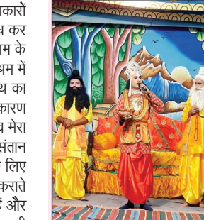
रामलीला का मंचन करते कलाकार

मसहूर बुलदेलेखण्डी कलाकारों ने लीलाओं का मंचन कर दर्शकों को मंत्रमुग्ध कर दिया