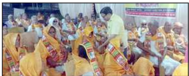
वृद्धाश्रम में वृद्धजनों की सेवा करते भक्तगण।

किया। वृद्धाश्रम में आने जाने से उनकी भावना से जो बातों से दर्द झलकता था जो वृद्धजन यहां रह रहे हैं उनको यह पल रहता है हम मरे लाल ने क्यों भेज दिया