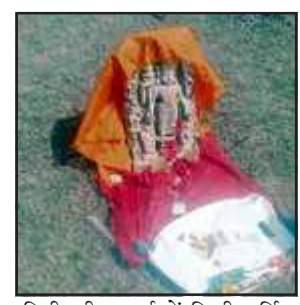
मिट्टी की खुदाई में मिली मूर्ति।

ग्राम प्रधान ने गांव में खाली पट्टी बांजर की जमीन पर भगवान विष्णु की मूर्ति को ग्रामीणों की सहमति पर सुरक्षित स्थान चिन्हित किया और मूर्ति की साफ सफाई करके पीले वस्त्र पहनाकर रखा गया जिसमें ग्रामीणों ने मूर्ति पर दान दक्षिणा भी चढ़ा कर पूजन अर्चन