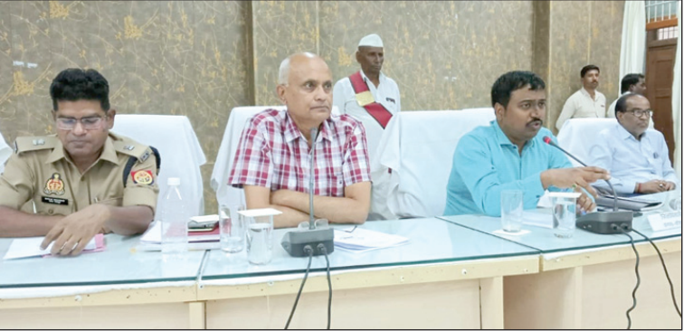
निर्वाचन की बैठक को संबोधित करते जिलाधिकारी

जिला निर्वाचन अधिकारी ने की नगरीय निकाय सामान्य निर्वाचन-2023 में अध्यक्ष पद, के लिए निर्वाचन लड़ने वाले समस्त उम्मीदवारों के साथ आदर्श आचार-संहिता के सम्बन्ध में बैठक, डीएम ने कहा कि सभी उम्मीदवार आदर्श आचार संहिता का करें अनुपालन