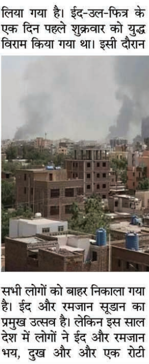
सभी लोगों को बाहर निकाला गया है। ईद और रमजान सूडान का प्रमुख उत्सव है। लेकिन इस साल देश में लोगों ने ईद और रमजान अपने नागरिकों और राजनयिकों

हालांकि, रैपिड एक्शन फोर्स ने कहा था कि वे विदेशी नागरिकों को सुरक्षित बाहर निकालने के लिए मदद करेंगे। इसलिए देश के हवाई अड्डों को कुछ समय के लिए खोला जाएगा। बता दें, फिलहाल यह तय नहीं हो पाया है कि किन हवाई अड्डों को खोला जाएगा। देश में जारी संघर्ष के कारण सैकड़ों लोगों की मौत हो गई। हजारों लोग घायल हैं। वहीं जो लोग जीवित हैं, वह खाने-पीने जैसे बुनियादी चीजों की कमी से जूझ रहे हैं। डर और दुख में ही बीता ईद सऊदी विदेश मंत्रालय ने बताया कि भारत, कुवैत, पाकिस्तान, कतर, मित्र, संयुक्त अरब अमीरात, ट्यूनीशिया, बांग्लादेश, बुल्गारिया, कनाडा, फिलीपींस और बुर्किना फासो के नागरिकों के साथ-साथ अपने 91 नागरिकों को सुरक्षित निकाल