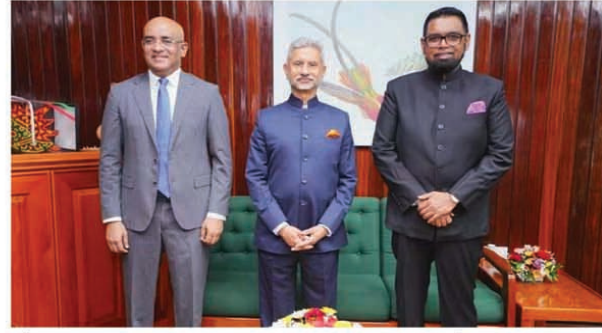
और उप-राष्ट्रपति भारत जगदेव से भी मुलाकात की। जयशंकर ने पांचवीं भारत-गुआना जाईंट

प्रधानमंत्री फिलिप और अन्य नेताओं से मिलकर बहुत खुश हैं। राष्ट्रपति-उपराष्ट्रपति से की मुलाकात विदेश मंत्री एस जयशंकर ने कहा कि उन्होंने ईस्ट बैंक-ईस्ट कोस्ट रोड लिंक प्रोजेक्ट का भी दौरा किया। इस दौरान गयाना के पीडब्ल्यूडी मंत्री देवदत्त इंदर भी विदेश मंत्री के साथ रहे। विदेश मंत्री ने प्रोजेक्ट में लगे कामगारों और स्टाफ से भी बातचीत की। इससे पहले एस जयशंकर ने गयाना के राष्ट्रपति इरफान अली