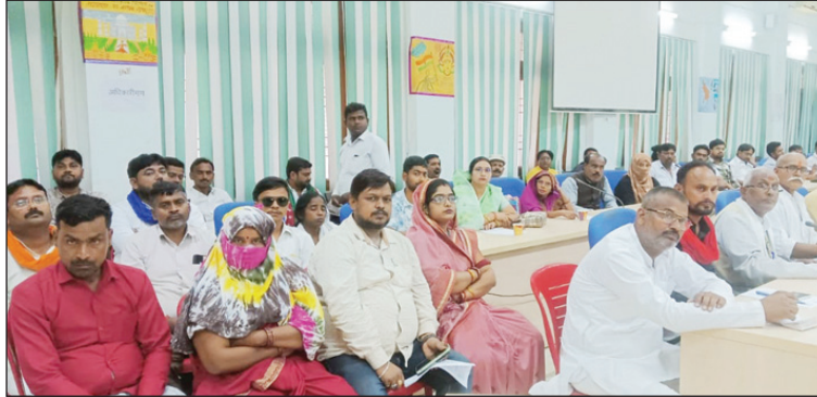
बैठक में उपस्थित प्रत्याशी व अधिकारी