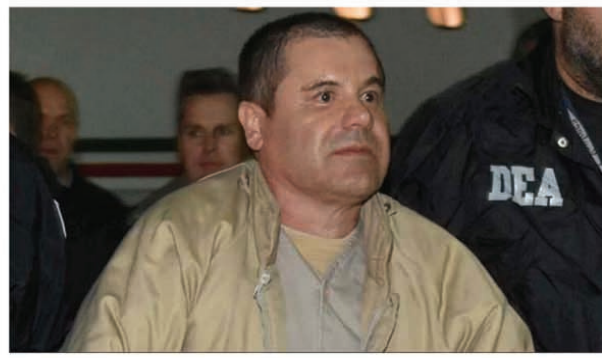
पर पिछले सप्ताह फेडरल तस्करी अभियान का आरोप लगा था।

चैपिटोस किसी को गोली मार देते हैं या किसी को जीवित या मृत